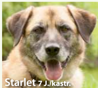
Starlet 7 J./kast.

Er liebt natürlich Spaziergänge, kann alleine bleiben und fährt prima im Auto mit. Ein Haus mit eingezäuntem Garten hätte wir gerne für diesen netten Buben.