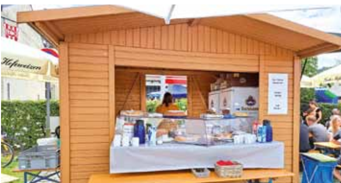
Elternbeirat der Schule Titting

Auch in diesem Jahr beteiligte sich der Elternbeirat der Schule Titting mit einem „Kuchenhäusl“ am Johannimarkt in Titting. Durch die vielen Kuchenspenden der Eltern konnte ein ansehnlicher Betrag gesammelt werden, der zu 100% der Schule für Aktivitäten und Anschaffungen zur Verfügung gestellt wird. Bereits im vergangenen Jahr wurden mit dem Erlös aus dem Johannimarkt z. B. Sitzkissen, Fußbälle und Musikinstrumente angeschafft. In diesem Zusammenhang nochmals ein herzliches Dankeschön an alle Bäckerinnen und Bäcker sowie an alle, die einen Kaffee und Kuchen vom Elternbeirat genossen haben und uns mit einer großzügigen Spende bedacht haben.