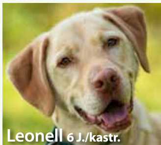
Leonell 6 J./kast.

Mitteilungsblätter erreichen 100% der Bevölkerung ihres Verbreitungsgebietes. Jeder Haushalt erhält monatlich ein Exemplar kostenlos.