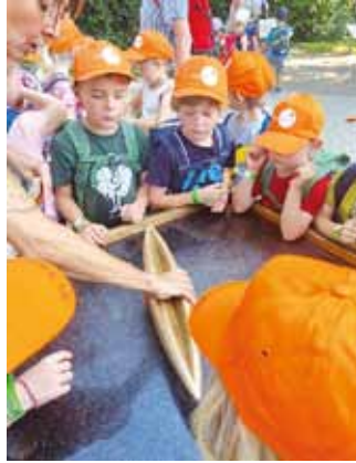
KiGa-Team St. Michael, Titting

Die Vorschulkinder begaben sich auf die Reise ins Erfahrungsfeld der Sinne nach Nürnberg. Mit dem Zug ging es in die Stadt. Dort angekommen ging es mit der U-Bahn weiter zum Erfahrungsfeld. Hier erkundeten die Kinder alle verschiedenen Stationen und erlebten vom Barfußpfad bis zum schiefen Haus alles. Die Station „Klangzelt“ wurde für die Kinder extra gebucht. Hier konnten sie mit verschiedenen Instrumenten Klänge erzeugen. Ein Eis durfte natürlich auf dem Programm nicht fehlen und danach ging es glücklich und mit vielen neuen Eindrücken zurück nach Hause.